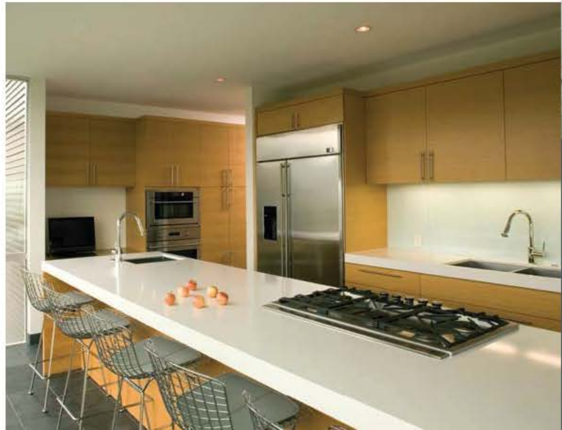
From left to right, from above to below: Rooftop view with solar panels, Living room, Dining area, Küche. Right: Living area with fireplace.